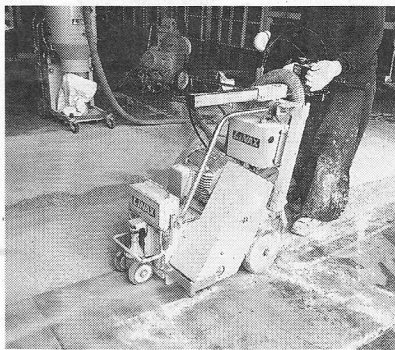
現場では特殊機材を使用

食品関連工場や店舗、ホテル、厨（ちゆう）房からの引き合いが増加。水系硬質ウレタンを採用し、低臭や耐熱水、耐衝撃性などの効力を発揮する。食品